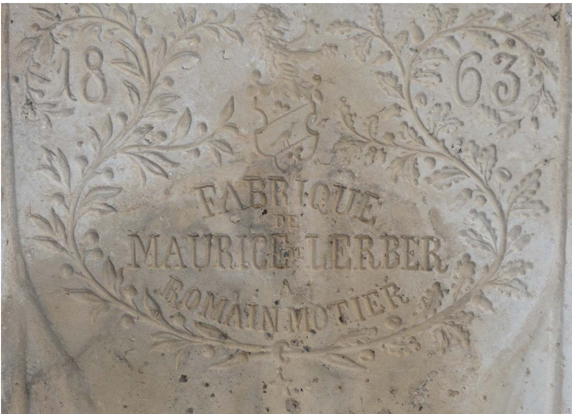
Des produits de haute qualité et qui plus est millésimés.