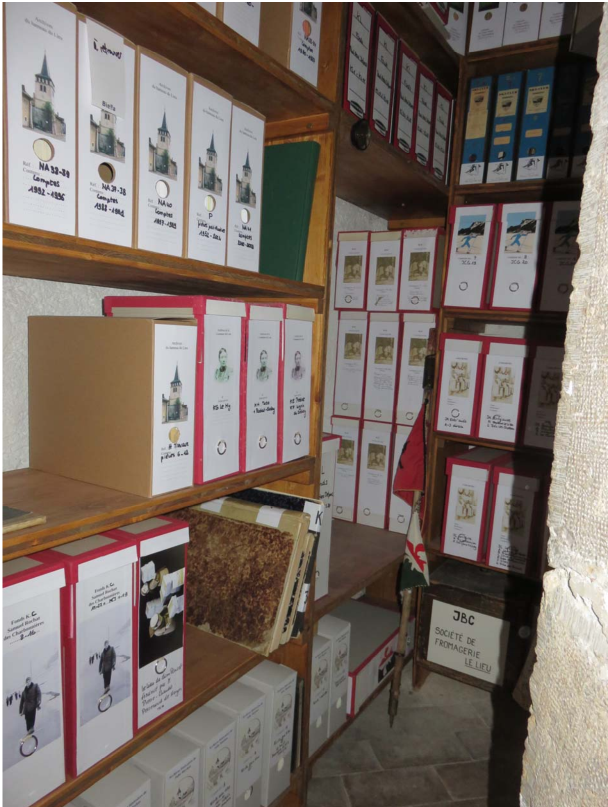
Un petit local, sol de planelles de terre cuite Lerber, qui vous fait remonter dans le temps.