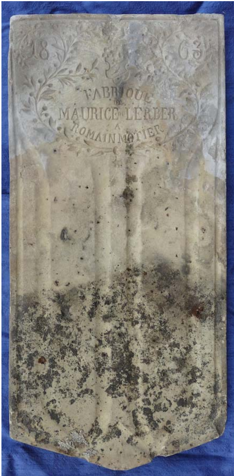
Les tuiles Lerber, sur certains vieux bâtiments de plaine, ont su défier le temps.