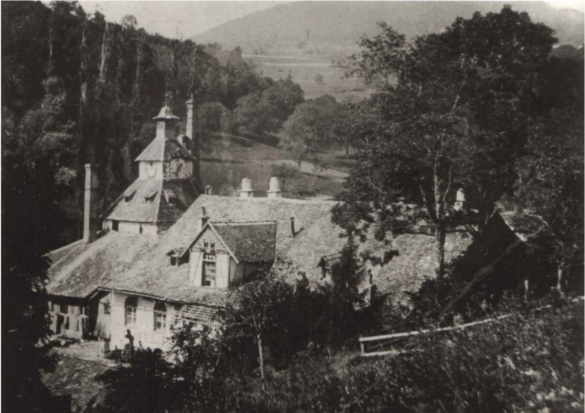
Quelques décennies plus tard. Le photographe a remplacé le dessinateur ou graveur.